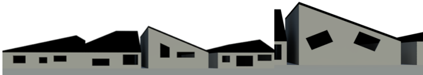
شکل ۱. شبیه‌سازی خانه‌ها و پنجره‌ها در داستان بوف‌کور

پنجره‌ها به چشم‌های گیج کسی که تب هذیانی داشته باشد شبیه بود... (هدایت، ۱۳۵۶: ۳۴). خانه‌های عجیب و غریب به شکل‌های بریده‌بریده هندسی با پنجره‌های متروک سیاه، کنار جاده رج کشیده بودند، ولی بدنه دیوار این خلنه مانند کرم شبتاب تشعشع کدر و ناخوشایندی از خود متصاعد می‌کرد... (همان، ۴۱).